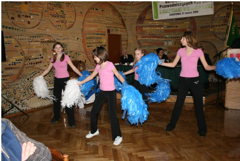
Występ dziewcząt z Zespołu Szkół w Zasutowie w Motelu „Polonia” w Podstolicach