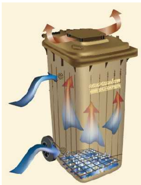
Rysunek 3 Pojemnik do kompostu SSI SCHAFFER - CT-120L