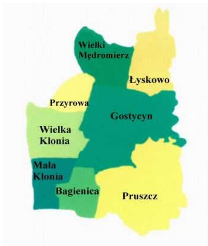
Rysunek 1 Gmina Gostycyn

Gmina Gostycyn położona jest w południowo - zachodniej części powiatu tucholskiego w województwie kujawsko - pomorskim przy drodze wojewódzkiej stanowiącej główne połączenie Tucholi z Bydgoszczą. Powierzchnię 136 km 2 zamieszkuje 5 272 osób (dane GUS na 31.12.2006). Zarówno pod względem liczby mieszkańców, jak i powierzchni zaliczana jest do grupy gmin mniejszych. Gmina posiada bardzo korzystny zwarty kształt, a ośrodek gminny położony jest centralnie i jest dobrze dostępny z terenu całej gminy.