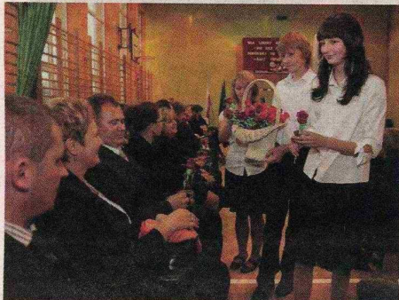
Każdy z zaproszonych gości otrzymał od uczniów różę.

Budowa gimnazjum w Hucie Krzeszowskiej kosztowała 3,8 miliona złotych. Większość pieniędzy na budowę szkoły przeznaczono z budżetu gminy. W gimnazjum naukę pobiera 118 uczniów.