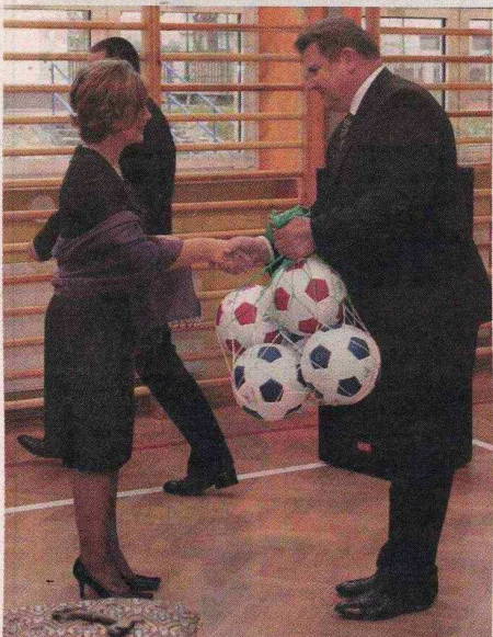
Zygmunt Cholewiński, marszałek województwa podkarpackiego przywiózł gimnazjalistom piłki, a wójtowi informację, iż gmina dostała wsparcie 500 tysięcy złotych na tę inwestycję.